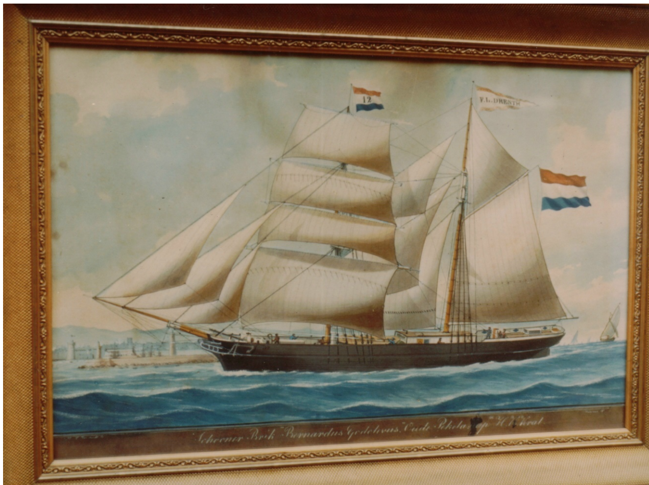
Portret (onbekende eigenaar) van de “Bernardus Godolevus” met een onderschrift “Schoenerbrik Bernardus Godolevus Oude Pekela H.H.Kral” Vlagnummer 12 van zeemanscollege “Trouw” te Oude Pekela. Kapiteinshuis Nieuwe Pekela