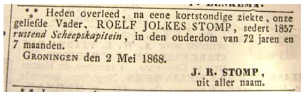
Provinciale Groninger Courant 07 mei 1868

Roelf Jolkes overleed op 02 mei 1868 te Groningen, 72 jaar, rustend schipper, weduwnaar