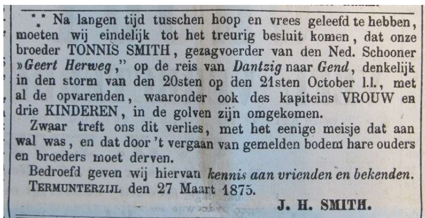
Provinciale Groninger Courant 27 maart 1875