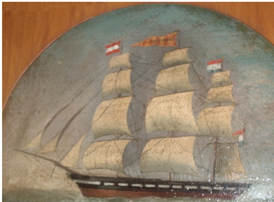
Barkschip Grootmeester Nationaal.