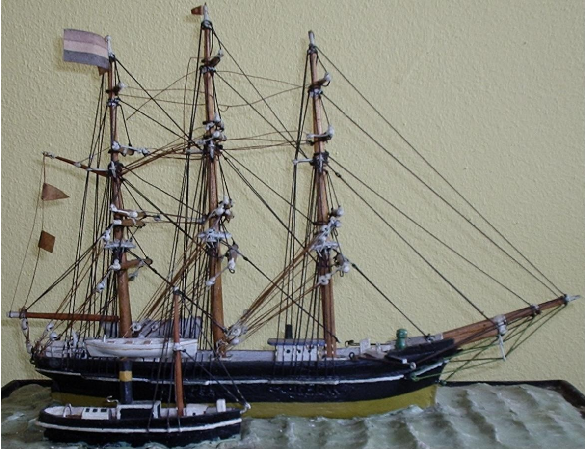
Het barkschip Atalante.

Het Pampus was een bekende zandbank voor de haven van Amsterdam die het binnenlopen van schepen soms ernstig bemoeilijkte. Minder bekend waren de Oude en Noorder Pampus, gelegen in het Haringvliet, die een belemmering voor de zeegang vanuit Dordrecht betekenden. Nadat deze 'hobbel' was genomen, kon de reis naar Oost-Indië een aanvang nemen.