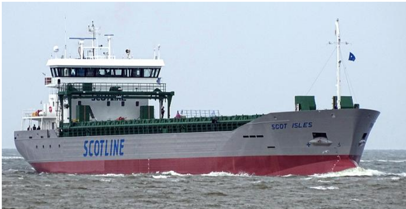
SCOT ISLES, IMO 9728758, 14-7-2021 terug van de proefvaart bij de Eemshaven