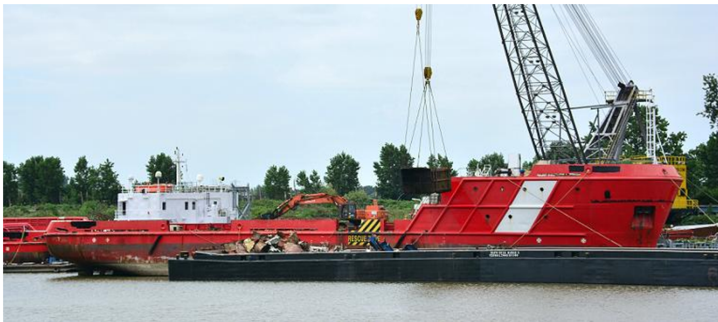
VOS POWER, IMO 9273911, ex POWER EXPRESS, 23-7-2021 te 's-Gravendeel.

TIME OFF, IMO 9882114, Supply Vessel YS5009, 24-6-2021 opgeleverd aan Damen Yachting Charter 1 B.V., Vlissingen, vlag: Marshall Islands (V7A2506) en vertrokken van Antalya naar Vlissingen. 499 GT, 270 DWT. 5-7-2021 vanaf Antalya te Vlissingen. 6-7-2021 proefvaart.