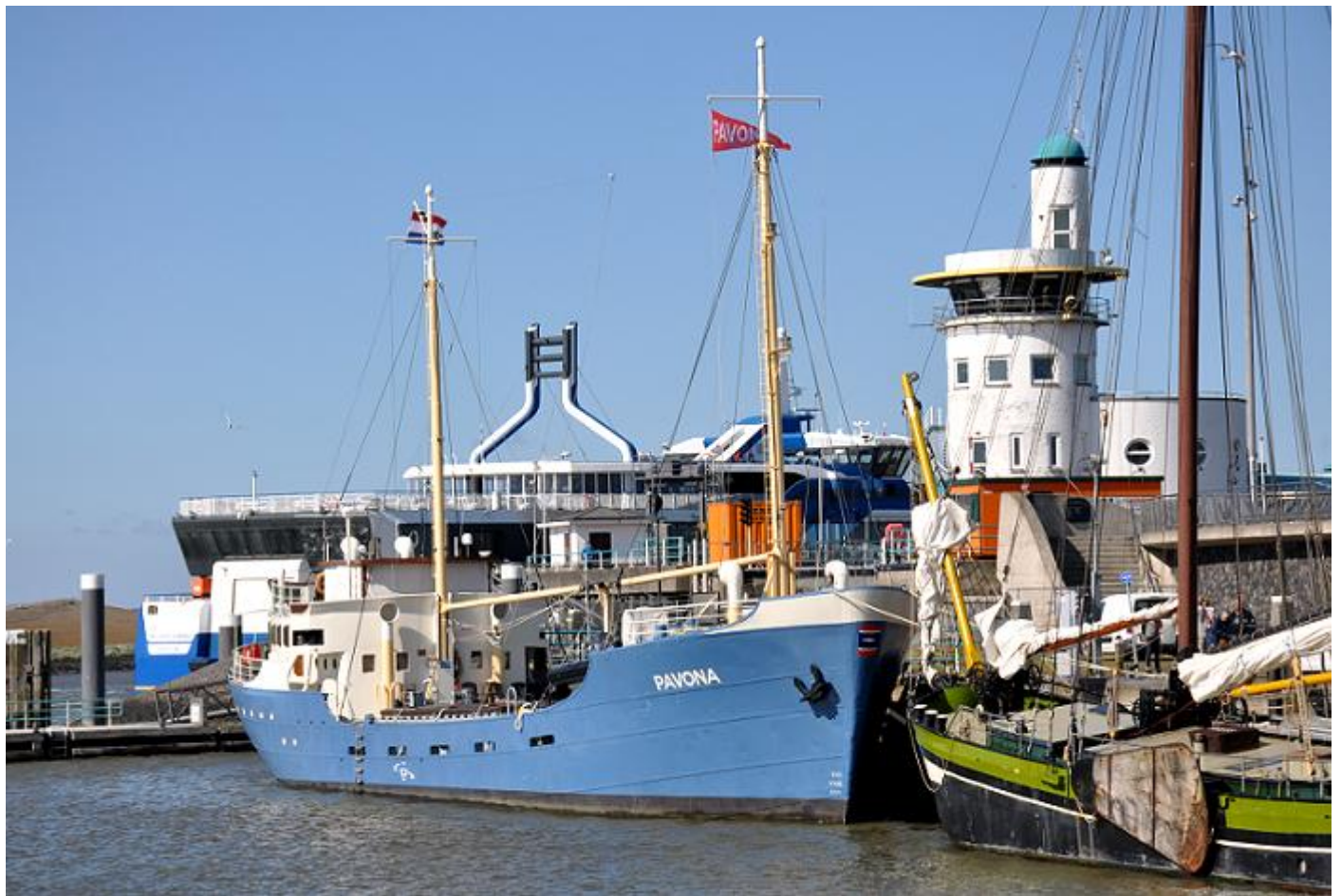
PAVONA, IMO 5064233 ex PAVONIS, foto: Riemer van Bolhuis, Harlingen, 7-7-2021

PARIS TRADER, IMO 9594494 (NB-275) 24-12-2008 kiel gelegd bij Zhejiang Ouhua Shipbuilding Co. Ltd., Zhoushan onder bouwnummer 583, 7-12-2011 (GL) opgeleverd als PARIS TRADER aan Paris Trader Beheer B.V., Winschoten, roepsein PBZO, in beheer bij Reider Shipping B.V., Winschoten. 22.863 GT, 33.217 DWT. 19-4-2012 (e) verkocht aan Paris Trader Schiffahrts G.m.b.H. & Co. K.G., St. John's-Antigua and Barbuda, roepsein V2GB7, in beheer bij Hermann Buss G.m.b.H. & Co. K.G., Leer. 11-12-2015 (e) in beheer bij Marlow Ship Management Deutschland G.m.b.H. & Co. K.G., Hamburg. 9-2-2018 (e) verkocht aan Bruce M5 Shipping Ltd., Liberia, roepsein D5PY6, in beheer bij Marlow Ship Management Deutschland G.m.b.H. & Co. K.G., Hamburg. 9-2020 herdoopt AAL PARIS. 7-2021 thuishaven en vlag: Limassol-Cyprus, roepsein 5BVD5.