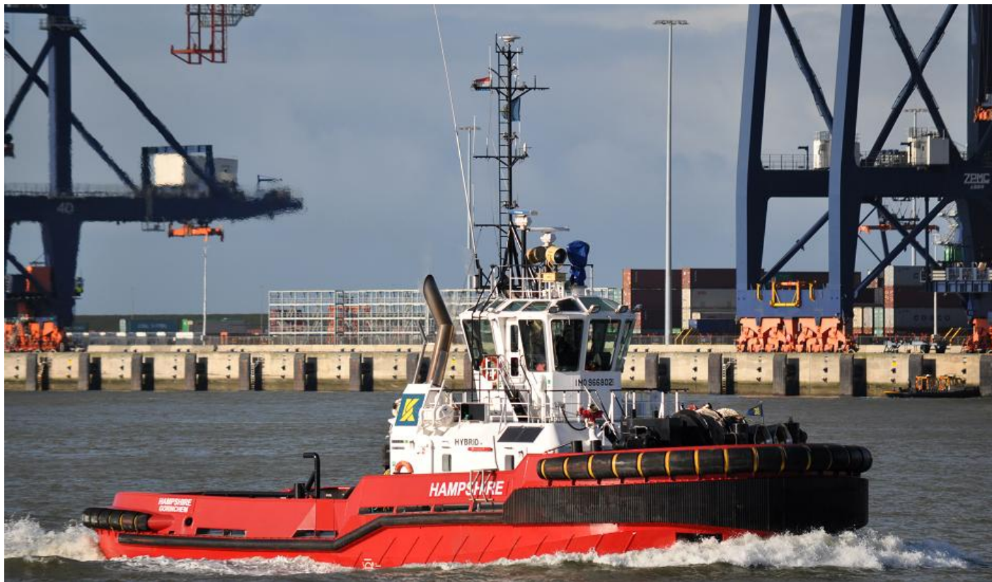
d.m.s. HAMPSHIRE, foto: L. v.d. Meijden, 2-2-2018