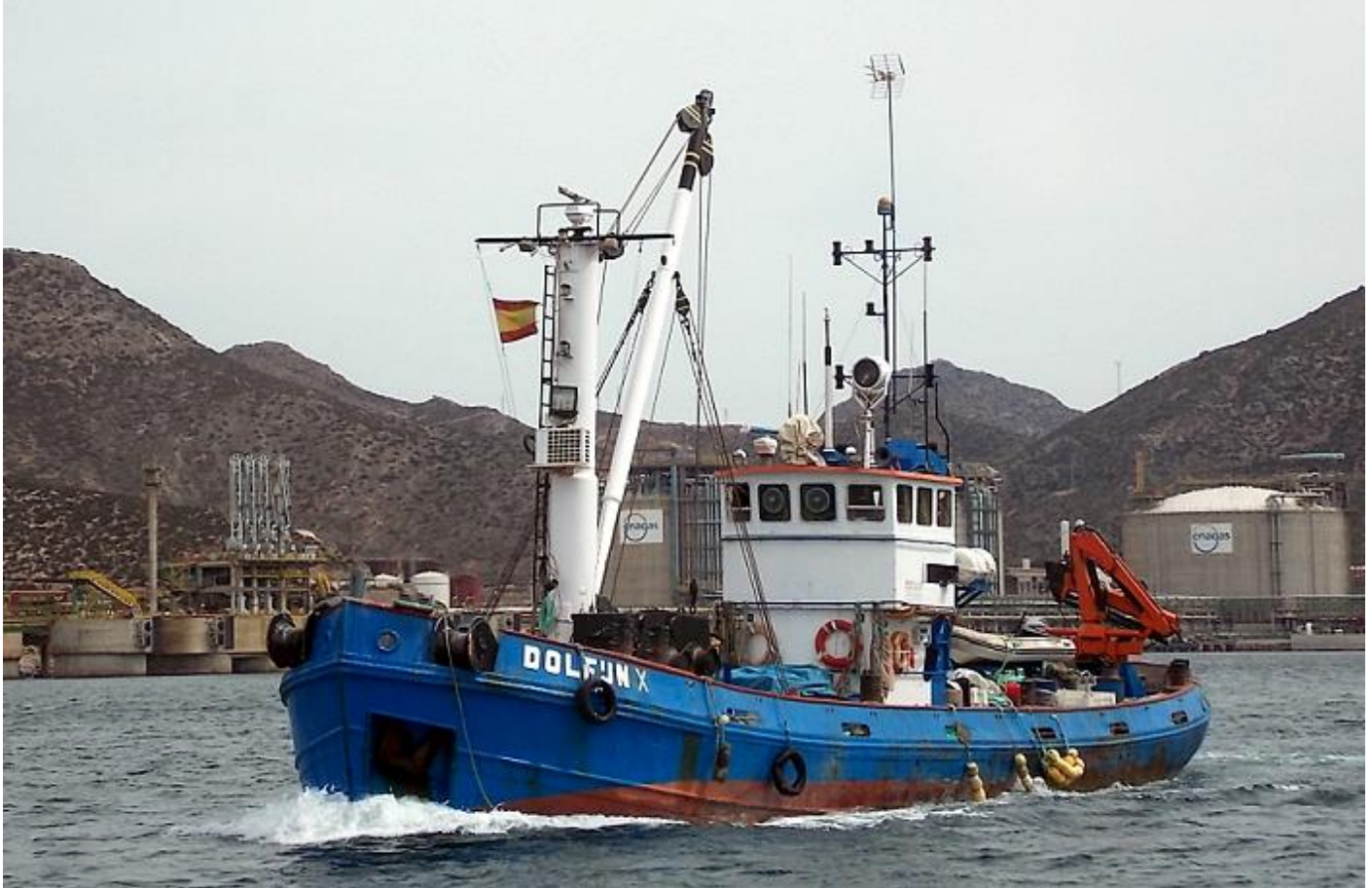
DOLFIJN X, foto: Capitán Carlitos, 1-4-2014, Escombreras, Cartagena, Spanje

DOLFIJN, IMO 8434142, 21-4-1953 opgeleverd door N.V. Scheepswerf "De Industrie" D. & J. Boot, Alphen aan den Rijn (1223) als DOLFIJN aan N.V. W.A. van den Tak Bergingsbedrijf, Rotterdam. Europeanummer 2708484. 16-4-1971 verkocht aan N.V. Smit-Tak Internationaal Bergingsbedrijf, Rotterdam. 1977 verbouwd en verlengd, 88 BRT, 29,00 x 5,85 x 2,450 x 2,15 meter, nieuwe motor geplaatst, 360 EPK, 265 kW, 12 cyl, 2 tew, G.M. 7124-7002, General Motors Corp. (#12VA51500). 3-6-1983 verkocht aan Maasberg B.V., Rotterdam, in beheer bij Smit-Tak Internationaal Bergingsbedrijf B.V., Rotterdam. 13-9-1990 als DOLFIJN verkocht aan Van den Akker Berging B.V., Vlissingen. 20-12-2000 als DOLFIJN verkocht aan Takmarine B.V., Rotterdam. 30-9-2003 als DOLFIJN verkocht aan Smit Transport Europe B.V., Rotterdam. 24-10-2003 als DOLFIJN verkocht aan M. Juijn, Cartagena, Spanje, ingebracht bij Remolcatuna S.L., Murcia-Spanje. 200- in de vaart als DOLFIJN X. 1-2018 als DOLFIJN te Cartagena op de wal om gesloopt te worden. (Foto: T. v.d. Zee).