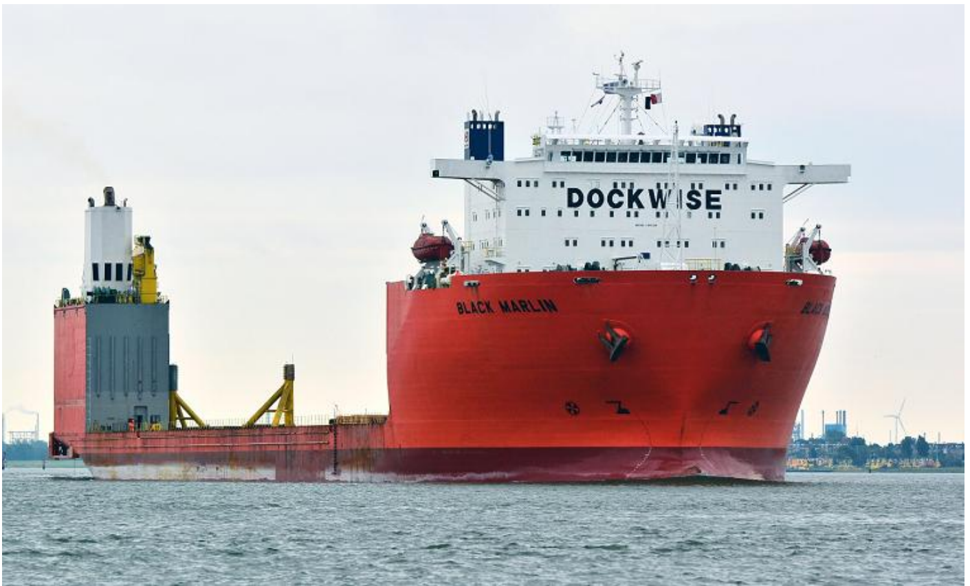
m.s. BLACK MARLIN, 28-8-2014