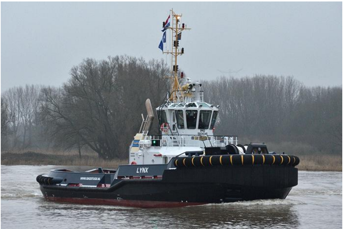
d.m.s. LYNX, 12-1-2018

Het nieuwe sleepbedrijf speelt in op die groei en ziet goede mogelijkheden voor een succesvolle sleepdienst in Delfzijl en de Eemshaven. Port Towage Groningen beschikt over moderne en krachtige sleepboten, die in staat zijn om ook de 14 meter diep liggende Panamax schepen te behandelen. Vanuit haar standplaats Eemshaven heeft het bedrijf standaard twee sleepboten beschikbaar en eventueel meerdere op afroep. De nieuwe sleper 'de Lynx', gebouwd bij Damen Shipyards, heeft er inmiddels samen met sleepboot 'de Mars' een vaste ligplaats.