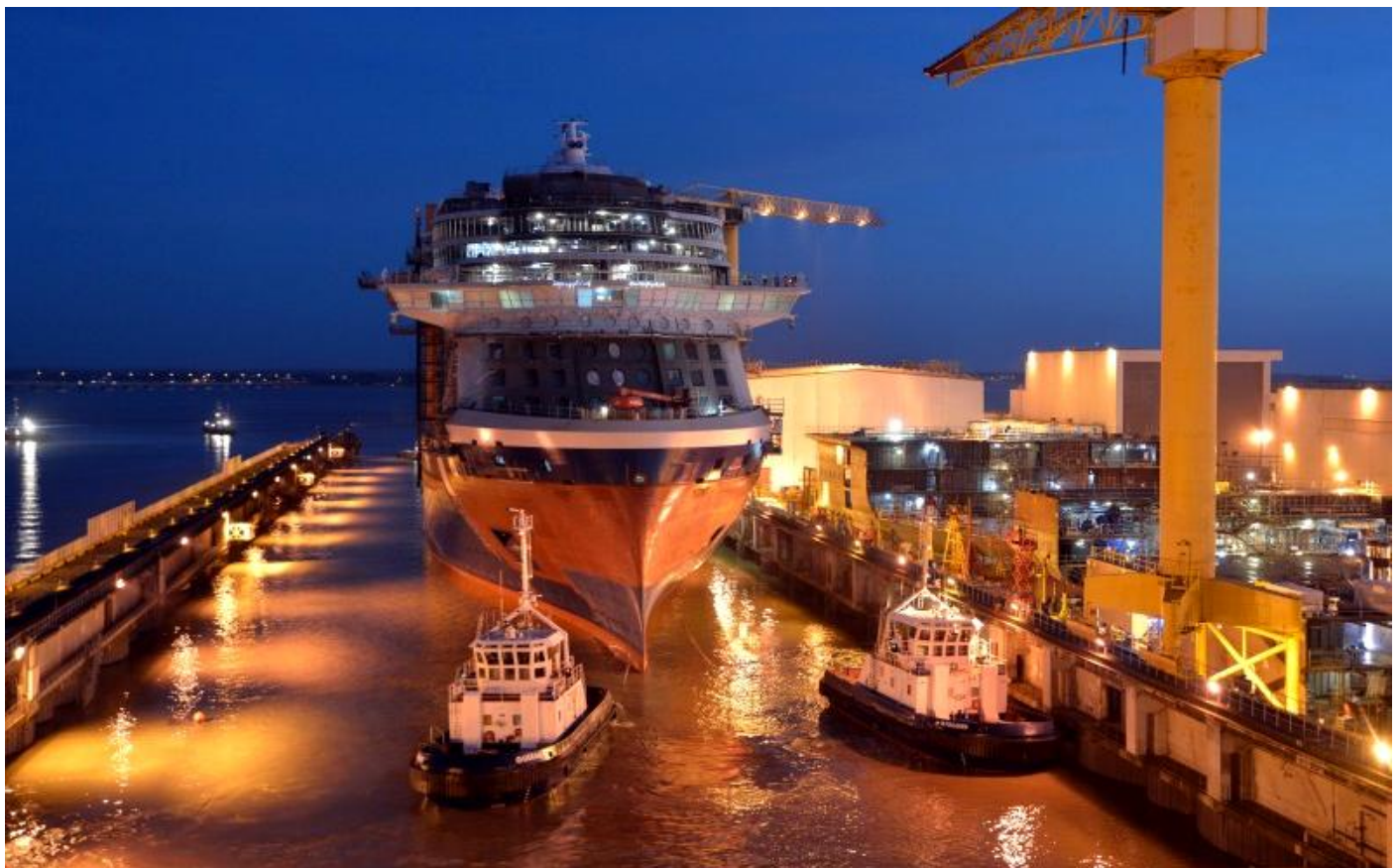
CELEBRITY EDGE te water gelaten bij STX France