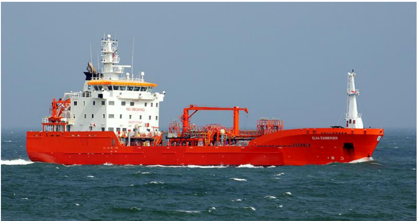
m.t. ELSA ESSBERGER, 17-7-2015