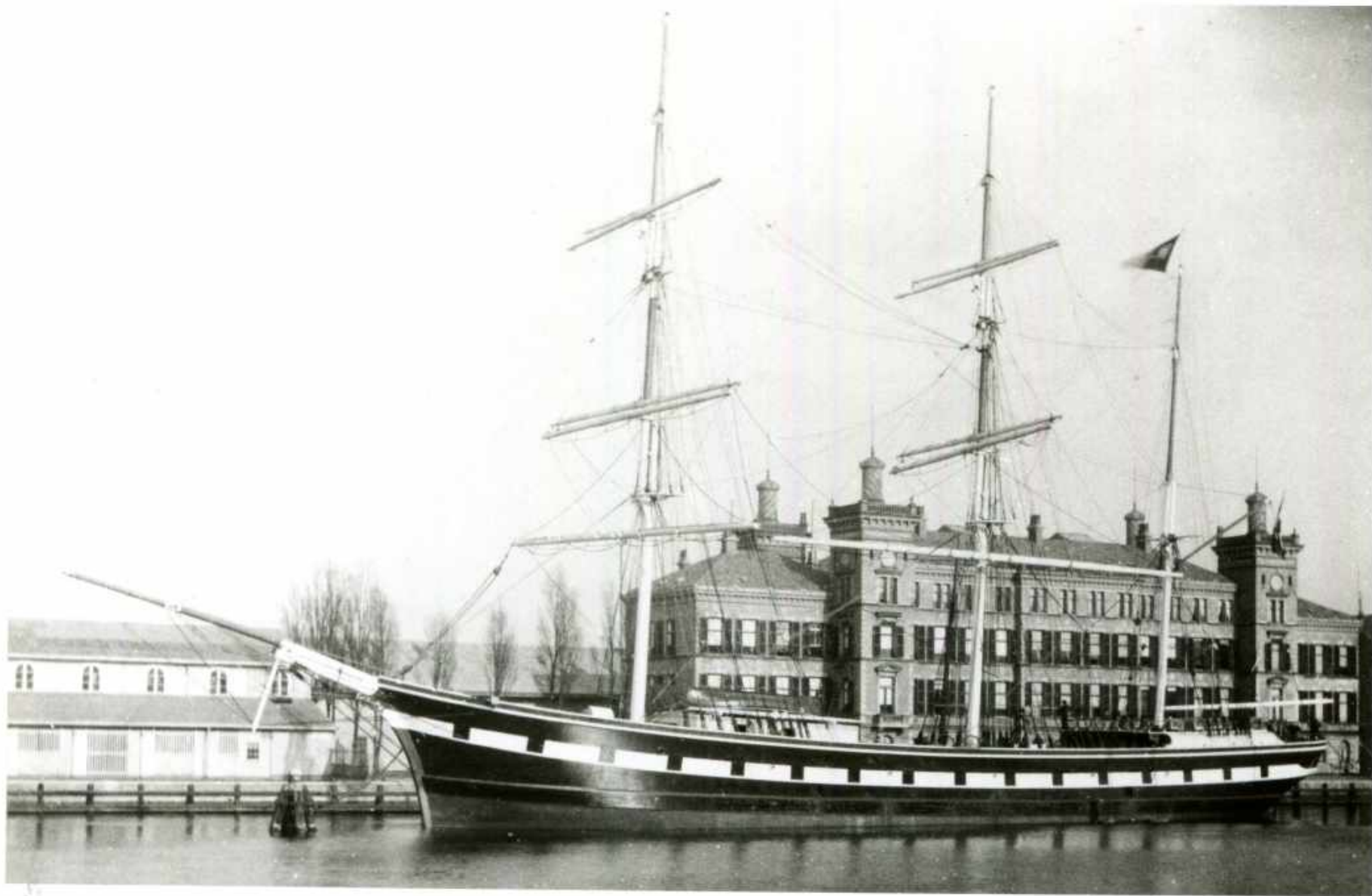
Composite Barkschip Nicolaas Beets.