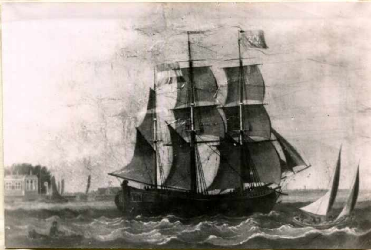
Galyoot bark Maria Frederica groot 200 Ton van 1000 sted. ponden, gebouwd in 1819 door Jos. Alta te Harlingen Tweeder Kapt. W. Swart - blaure vlag (oud college te Abden. Opriecht op het ij bij het Tolhuis