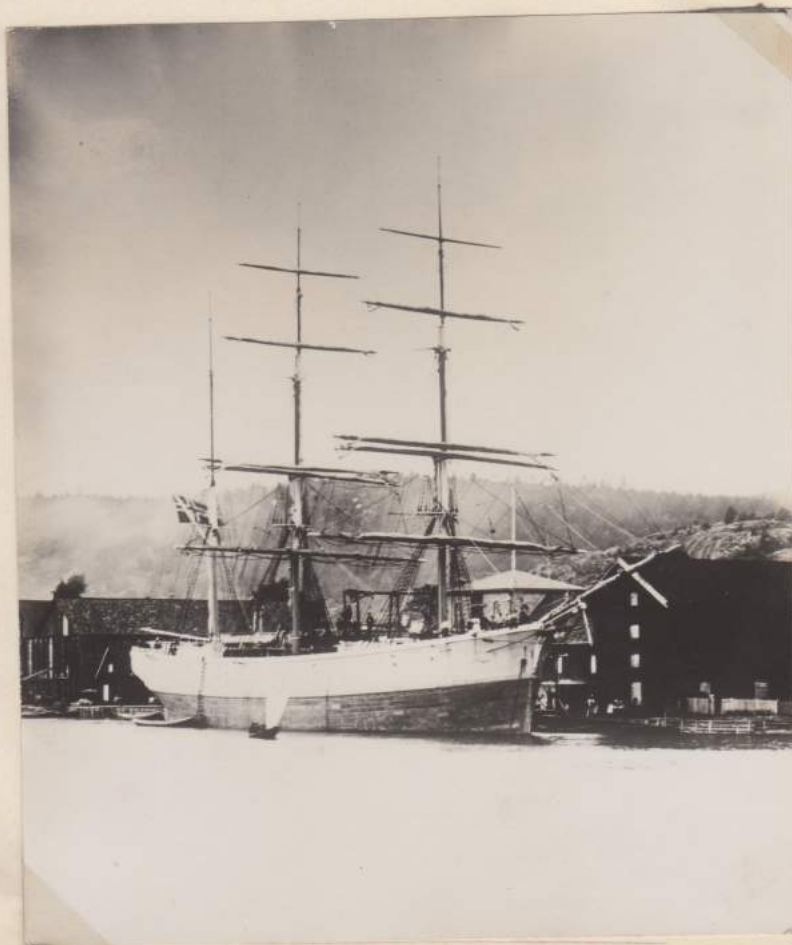
"SMEROE" onder Neersche vlag, te Persgrund

91 Maarsstengen 50 voet X I6. Bram 50 voet X I2 Bezaanssteng 70 " X I5 Onder ra' 82 " X I8 Mars ra' 66" X I4 en 67 voet Bram " 52 " X II Bovenbram ra 38 X 8 " Boegspriet 30 " " 20 Kluiverboom 52 X I4 " Bezaansboom 45 " " 9 Gaffel 36 " 8 " Voorhut 28 vt lang - 22 X 21 breed. Achterhut 44" " - 22 X 88 " Grootluik I5 X I4 of 4,36 meter X 3,95. Voor " 4 X 6 Am. voet. Achter " 4 X 6 " ". Ballastpeerten 20 X 30 Duim Het schip is den 4de Dec. 1878 in het drijvenddroeg dek te Amsterdam, van Meijjes omgevallen, en met pot lood stond eronder gescheven; leeg met vol tuig op, bovendien zijn de hutten enz. op het dek te lang en te groot en te zwaar geworden en is het tuig ook wat groot. Het schip is voor de eerste reis den 7de april 1879 van Ymuiden naar Soerabaja uigezeild, onder Kapt. J.C. Strootman. In de Indische oceaen bij stormweer had het waterstagen, kluiverboom en yzeren boegspriet gebroken, het tuig is behouden gebleven. In 1881 werd het schip bevracht van Calcutta naar Trinidad (WestIndië) a 65 sh. per ton voor rijst en koeliesstores, en zou in mei derwaarts vertrekken. In 1883 is Kapt. Strootman overleden en op de reis opgevolgd door Kapt. J. Heedemaker, die toen stuur man was