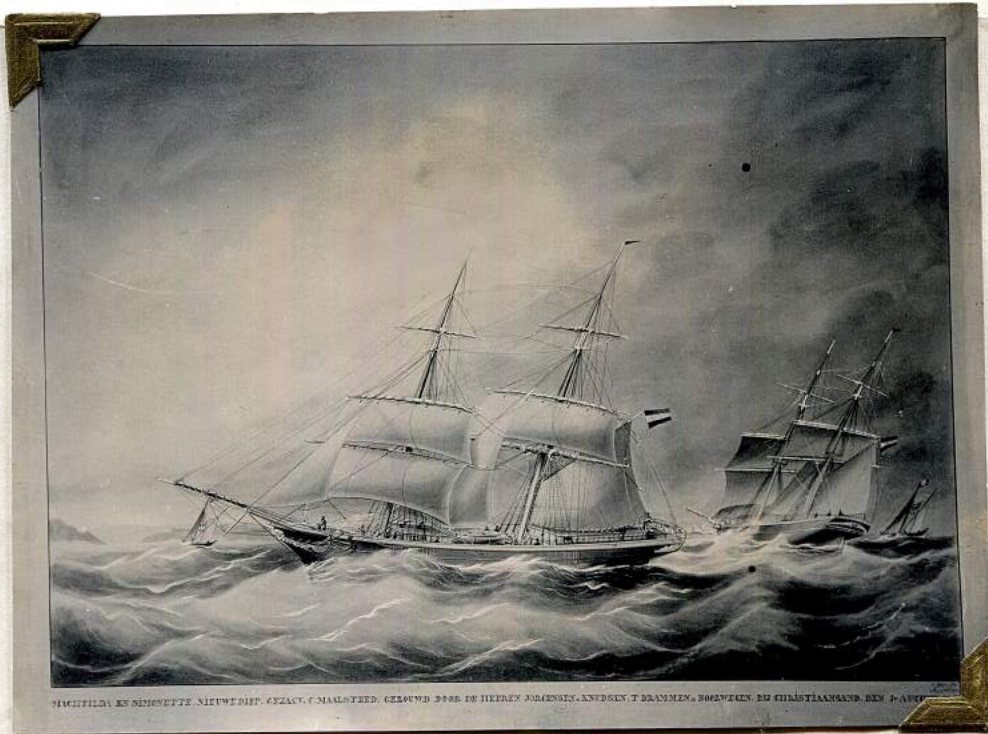
MACHTILDA EN SIMONETTE. NIEUWEDIJF. GEZACHT. C. MAALSTEEDE. GEBOUWD DOOR DE HEEREN JØRENSENS. EN KNUDSEN. T. DRAMMEN. 200 REG. TON. EN CHRISTIAANSZ. DEN 14. JULI 1868.

Volgens meetbrief lang 365, wijd 5, 90. Hol 3, 41, al zee groot 325 ton of 171 last. Ligt in de Haring vliet. Is in 1864 nieuw van stapel geleopen en in het voorjaar van 1868 te Rotterdam nieuw gekoperd