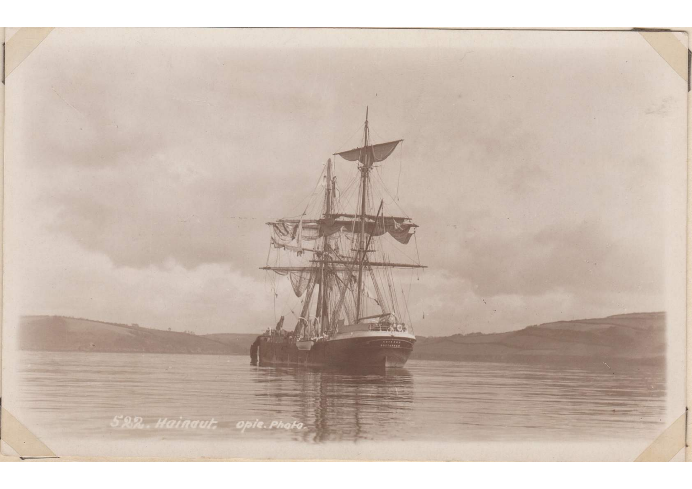
522. Hainaut. Opie. Photo.