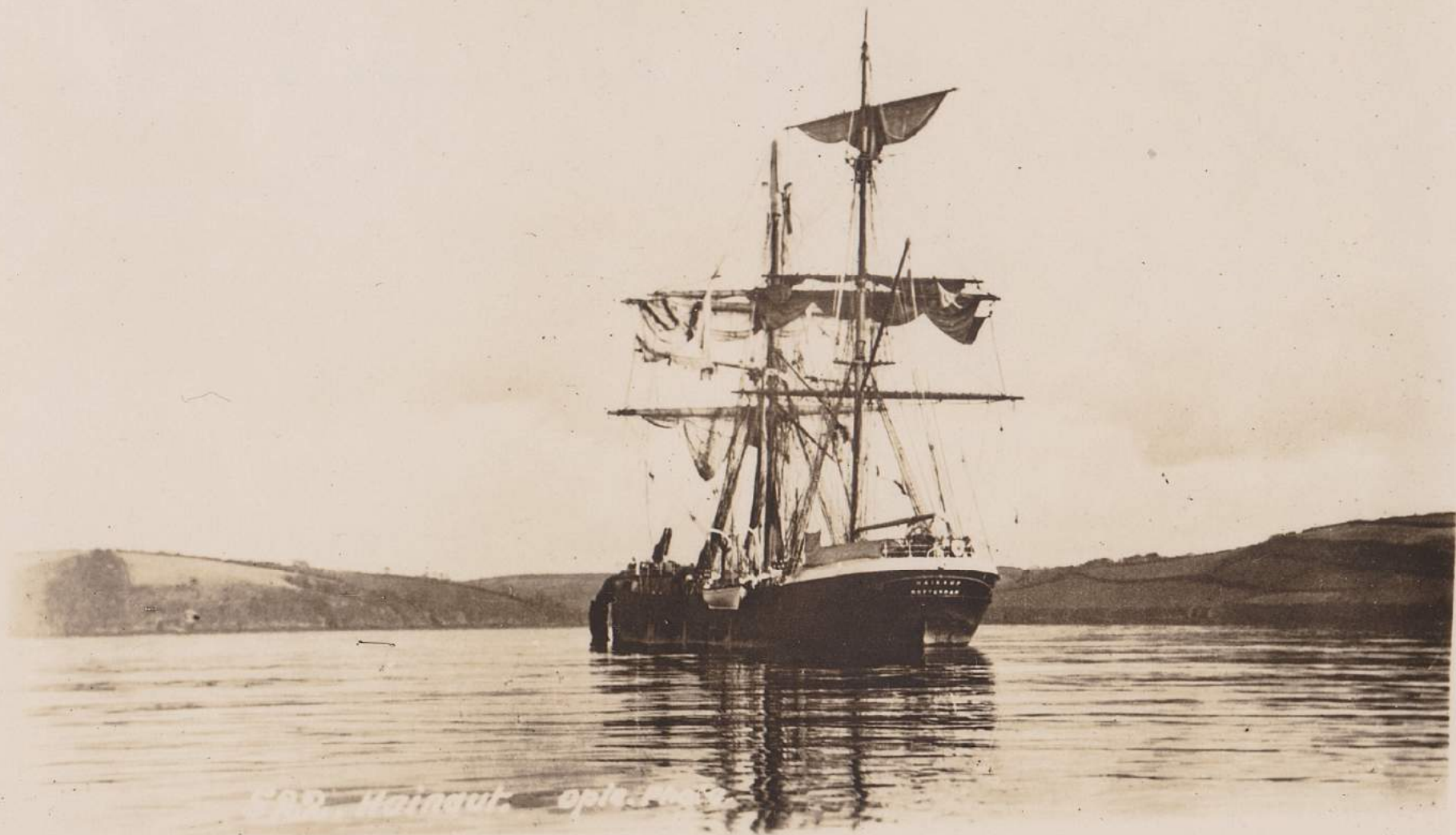
HAINAUT - 1914