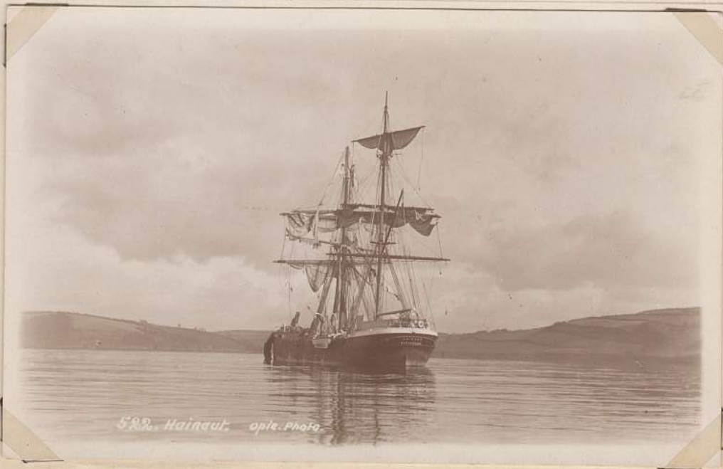
582. Hainaut. opt. Photo.

Op de foto ziet men de "HAINAUT" met zware schade in het tuig te Falmouth binnen.