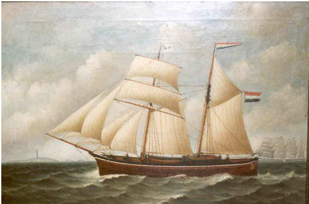
Schilderij van de schoenergaljoot 'Jacobus David' in het Noordelijk Scheepvaartmuseum te Groningen

Het sloopstypetype galjoot was in de 18 e en 19 e eeuw als kustvaarder in gebruik bij de Scandinaviërs, Duitsers, Nederlanders en Belgen. Aanvankelijk was dit type schip in de 17 e eeuw in Nederland een klein rondgebouwd vaartuig met zijzwaarden. Het tuig was een anderhalfmasttuig, waarvan de grote (voor-)mast een gaffelzeil en fok voerde, terwijl op de boegspriet een kluiver stond. De bezaansmast achterop droeg een latijnzeil. In de loop der jaren ontwikkelde men dit sloopstypetype tot een efficiënte kustvaarder. De Groninger sloopbouwers wijzigden in de 19 e eeuw geleidelijk de romp van deze galjoot. Het voorschip kreeg uiteindelijk de vorm van een schoener, terwijl het achterschip slanker en met meer geveegde lijnen werd gebouwd. Hierdoor kreeg het schip een grotere koersstabiliteit en verlijerde het minder snel. Daardoor konden de zwaarden verdwijnen. De op deze wijze aangepaste romp werd van een (topzeil-)schoenertuig voorzien. Het draagvermogen van de Groninger galjoten bewoog zich in het midden van de 19 e eeuw tussen de 110 en 125 ton. Voor meer informatie over de galjoot in het algemeen zij verwezen naar de Maritieme Encyclopedie 1) .